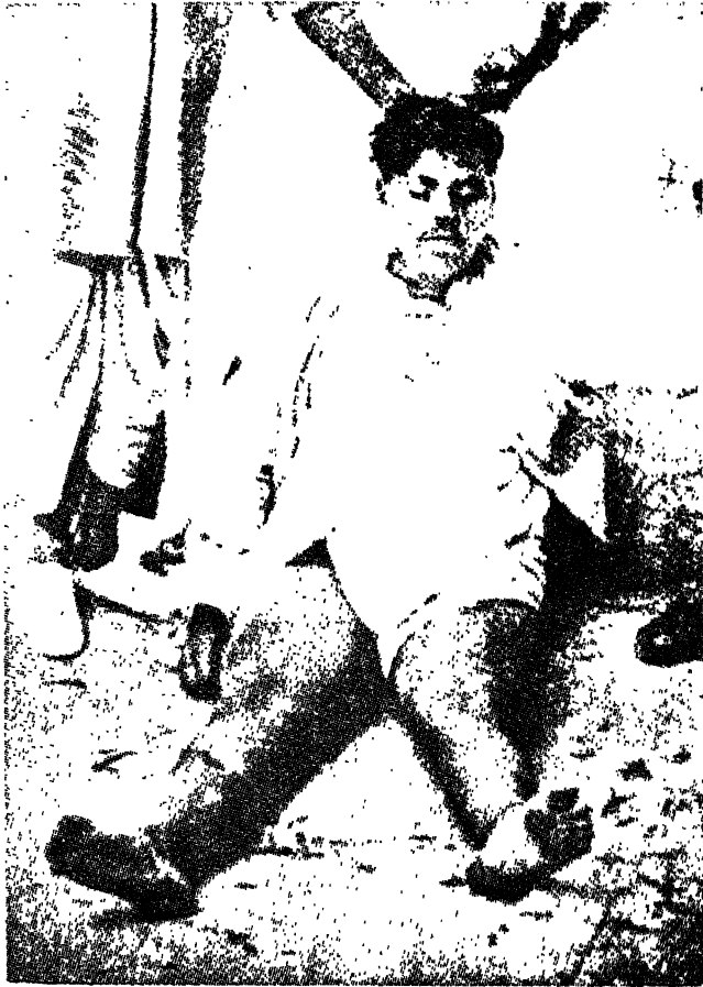
चन्द्रशेखर आज़ाद की शहादत के बाद पुलिस द्वारा लिया हुआ चित्र